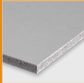
Powerpanel H 2 O