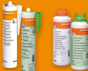
Estrichkleber und Estrichkleber greenline