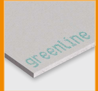
Gipsfaser-Platte greenline und Gipsfaser-Platte