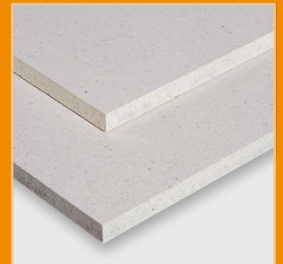
Estrich-Elemente ohne und mit Holzfaserkaschierung sowie greenline mit Holzfaserkaschierung

Das Kölner eco-Institut hat die hohe Umweltverträglichkeit von Fermacell Produkten mit einem speziellen Prüfsiegel bestätigt. Nur ausgereifte Produkte, deren Bestandteile toxikologisch unbedenklich und möglichst umweltverträglich sind, erhalten das begehrte eco-Label des renommierten Prüfinstituts.